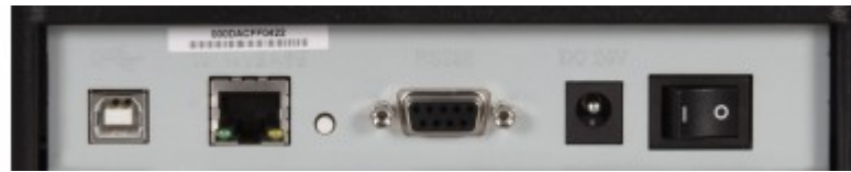
Ethernet LAN, USB und serielle Schnittstelle standardmäßig